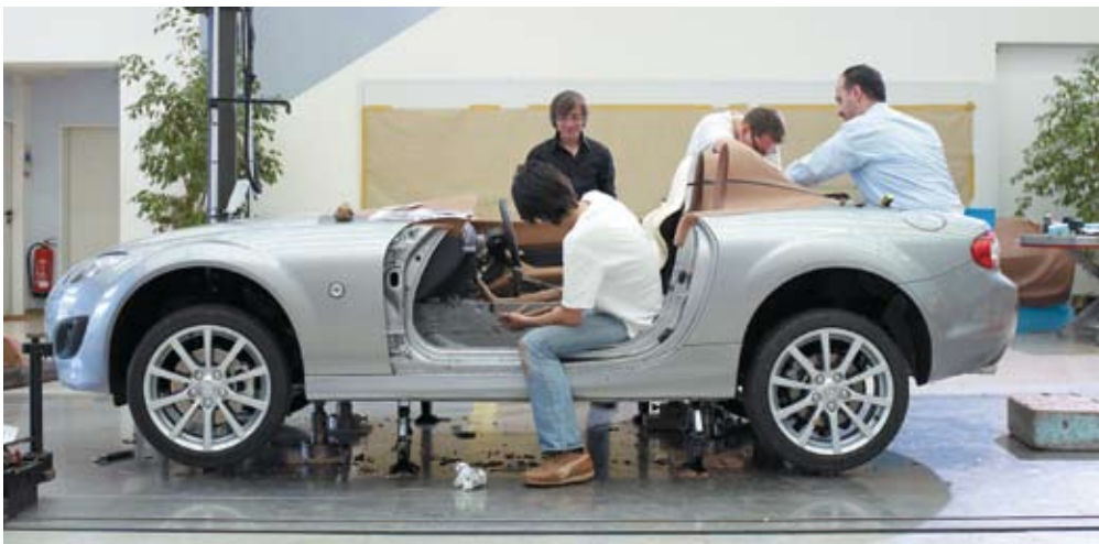
Команда дизайнеров «выкидывает» все лишнее из MX-5

Минимализм характерен не только для внешнего облика, но и для интерьера версии MX-5 Superlight. И это - не самоцель, и не просто эффективный способ снизить массу автомобиля. Минимализм - это способ помечтать об идеальном автомобиле. Как известно, совершенство - это когда нет ничего лишнего (подробнее см. стр. 4).