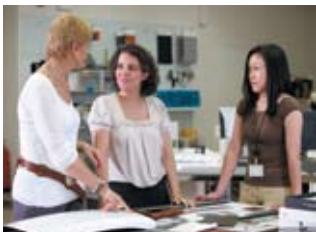
Совещание группы по интерьерам

потратил всего три месяца. Руководитель быстро сформировал команду дизайнеров. Работу начали с кокпита.